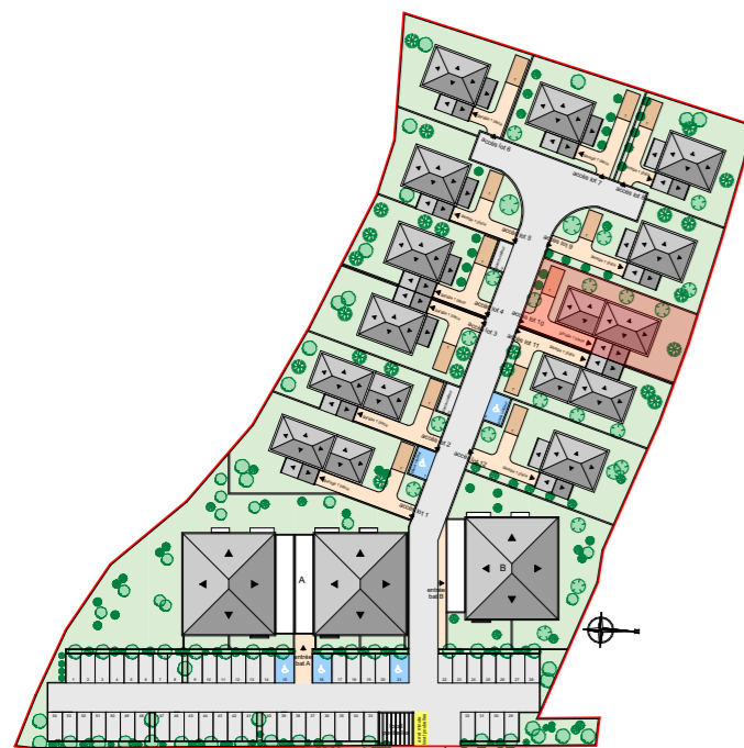
REPERAGE PLAN DE MASSE