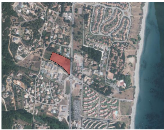
COMMUNE DE POGGIO MEZZANA